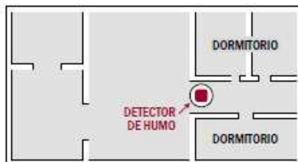
UN SOLO PISO